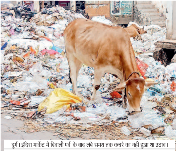
दुर्ग। इंदिरा मार्केट में दिवाली पर्व के बाद लंबे समय तक कचरे का नहीं हुआ था उठाव।

उल्लेखनीय है कि, पिछले साल के स्वच्छता सर्वेक्षण 2022 में देशभर के एक लाख की आबादी वाले शहर को शामिल किया गया था। इस दौरान निगम को देशभर में 27वां रैंक मिला था। लेकिन इस बार सुधार करने के बजाय निगम का खराब प्रदर्शन रहा और 84वें पायदान पर पहुंच गया। निगम प्रशासन सहित जिम्मेदार अधिकारियों की गैर रवैये के चलते भी लोगों में नाराजगी है। स्वास्थ्य अधिकारियों सहित मैदानी अधिकारी शिकायत किए पर फोन तक नहीं उठाते हैं। आनलाइन शिकायत का भी बुरा हाल है। इन तमाम लापरवाही के चलते भी निगम को टोस रैंकिंग नहीं मिल पाई और आज सफाई में करोड़ों फूंकने के बाद भी रिजल्ट फिसट्टी साबित हुई है।